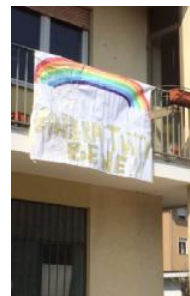
A Schio in viale dell'Industria