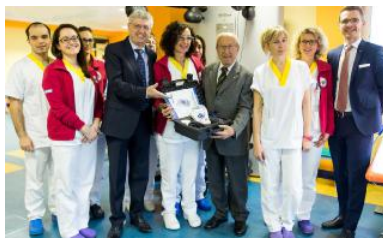
Il dispositivo è stato donato all'ospedale dalla Fondazione S. Bortolo

I PROGETTI. La giunta ha approvato i lavori