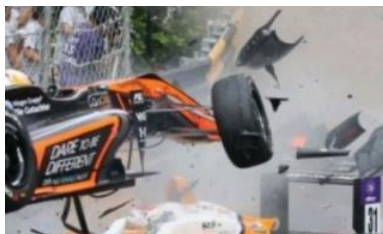
Un frame del video che ritrae lo spaventoso incidente a Macao