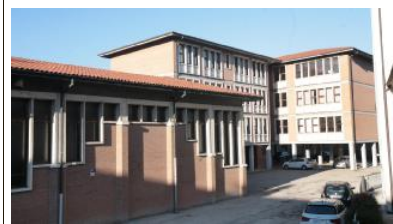
La scuola media Maffei, tra gli istituti dove sono previsti lavori

I PROGETTI. La giunta ha approvato i lavori