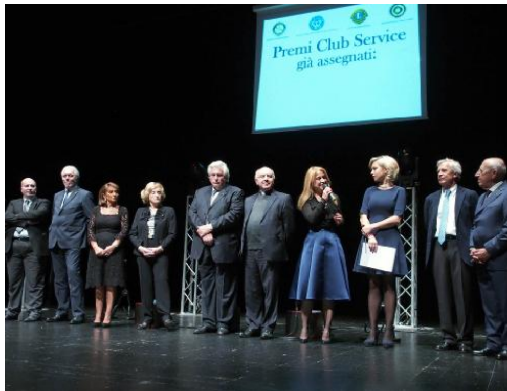
La presentazione ieri sera al Comunale del progetto di solidarietà legato al premio Club Service

Molti interventi medici possono essere affrontati con metodiche mini invasive, in particolare quella laparoscopica e robotica. I vantaggi più rilevanti di queste tecniche, rispetto a quella tradizionale, consistono nella magnificazione delle immagini, nell'utilizzo di telecamere e monitor ad alta definizione e, potenzialmente, nell'uso della tecnologia 3D. Quest'ultima, sempre più impiegata negli ultimi anni, è tuttavia gravata da alcuni inconvenienti, in primis l'affaticamento visivo. I ministeri dello Sviluppo tecnologico e della Salute hanno suggerito di limitare il suo utilizzo, soprattutto da parte dei soggetti in tenera età. Il sistema "Kiwie RealVision" rappresenta un'evoluzione di questa tecnologia: consente una visione da varie angolazioni, non soffre di perdite di luminosità e trasmette immagini a profondità reale. Rispetto al sistema 3D genera un'esperienza visiva reale, dissociata per i due occhi, tollerata, con una distanza percepita reale e non variabile da soggetto a soggetto. I risultati della sperimentazione condotta con i reparti di urologia, oculistica e neurologia indicano che il sistema garantisce un'ottima qualità delle immagini, senza affaticamento visivo per l'équipe chirurgica. AN. LAZ.